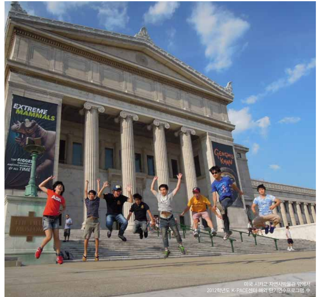
미국 시카고 자연사박물관 앞에서 2012학년도 K-PACE센터 해외 단기연수프로그램 중