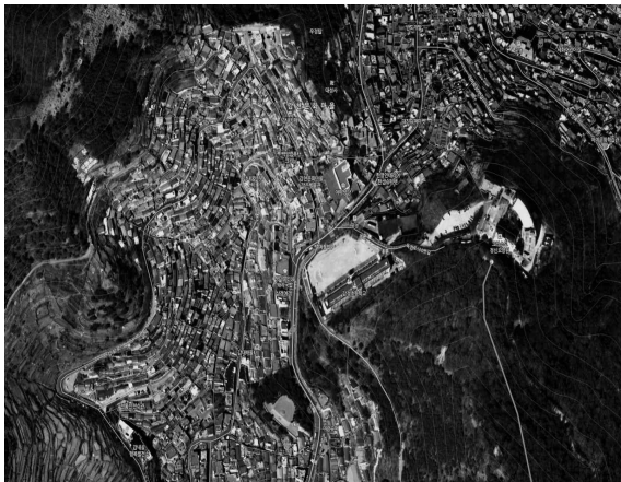
<그림 1. 감천문화마을>

산복도로 르네상스 프로젝트의 물살과 함께 문화체육관광부 지원의 ‘2009년 마을미술 프로젝트’는 감천문화마을 조성사업의 시발점이다. 감천문화마을 조성사업이 본격적으로 추진되기 시작한 것은 2010년이며, 독특한 경관과 공간적 가치를 살려 마을의 모습을 최대한 보존하면서 문화·예술적 요소를 가미한 주민참여형 도시재생 방식의 개발이 진행되었다. 내용적 범위는 먼저 연구의 주요한 개념인 도시재생과 주민참여에 관한 개념 및 내용을 살펴보고 주민참여가 실제로 사업에서 의미를 가지는지 주민만족도를 통해 알아본다.